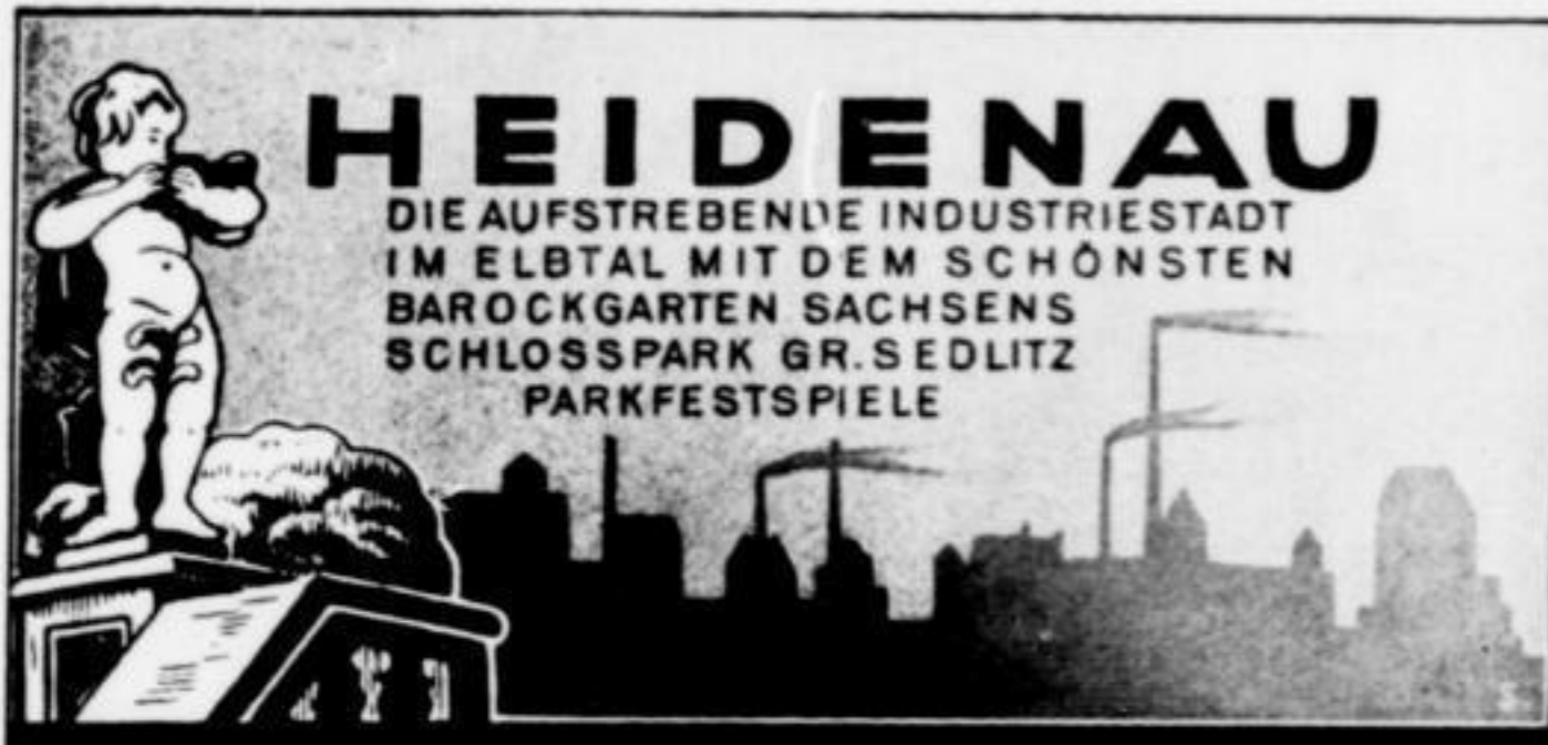
Schloßpark Großsedlitz. Blick zur „Stilien Musik“