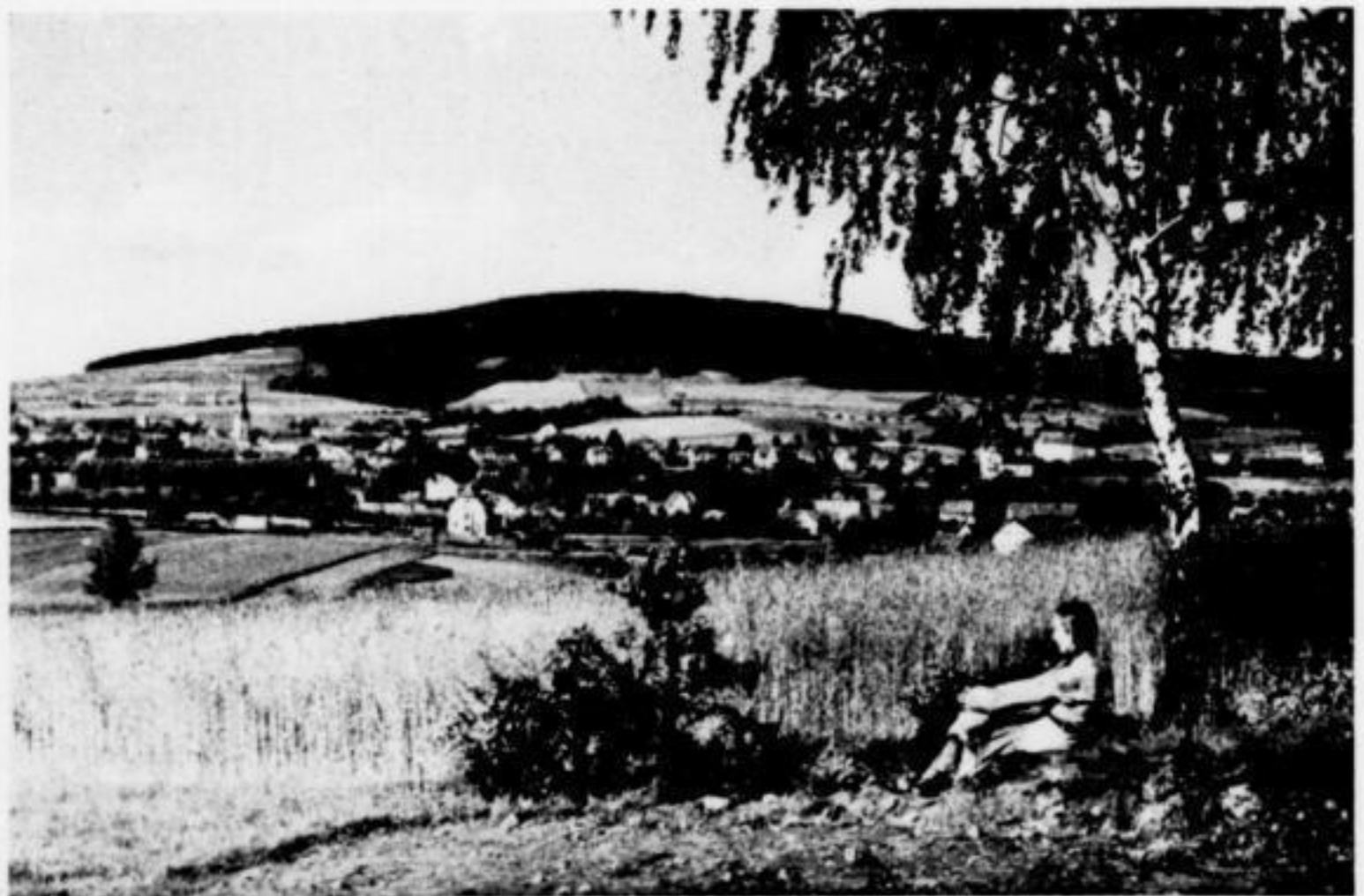
Gesamtansicht von Großpostwitz

und Wintersportplatz im Mittel- lausitzer Bergland. Weifa liegt abseits der großen Verkehrs- straße und ist doch leicht er- reichbar (Eisenbahn, KVG., Post), frei von jeder Industrie und Lärm, ruhige Lage in- mitten von Feldern, anmutigen Wiesenhängen, windstillen Talgründen und herrlichen Mischwäldern. Ruhebänke an den schönsten Aussichtspun- kten, bietet Ausflüge in die wald- und bergreiche Um- gebung, Gastlichkeit in guten Gaststätten, Pensionen, Privat- quartieren und Erholung vom Alltag, wie sie sich jeder Gast wünscht. Schwimmbad in nächster Nähe. — Aus- kunft durch den Bürgermeister