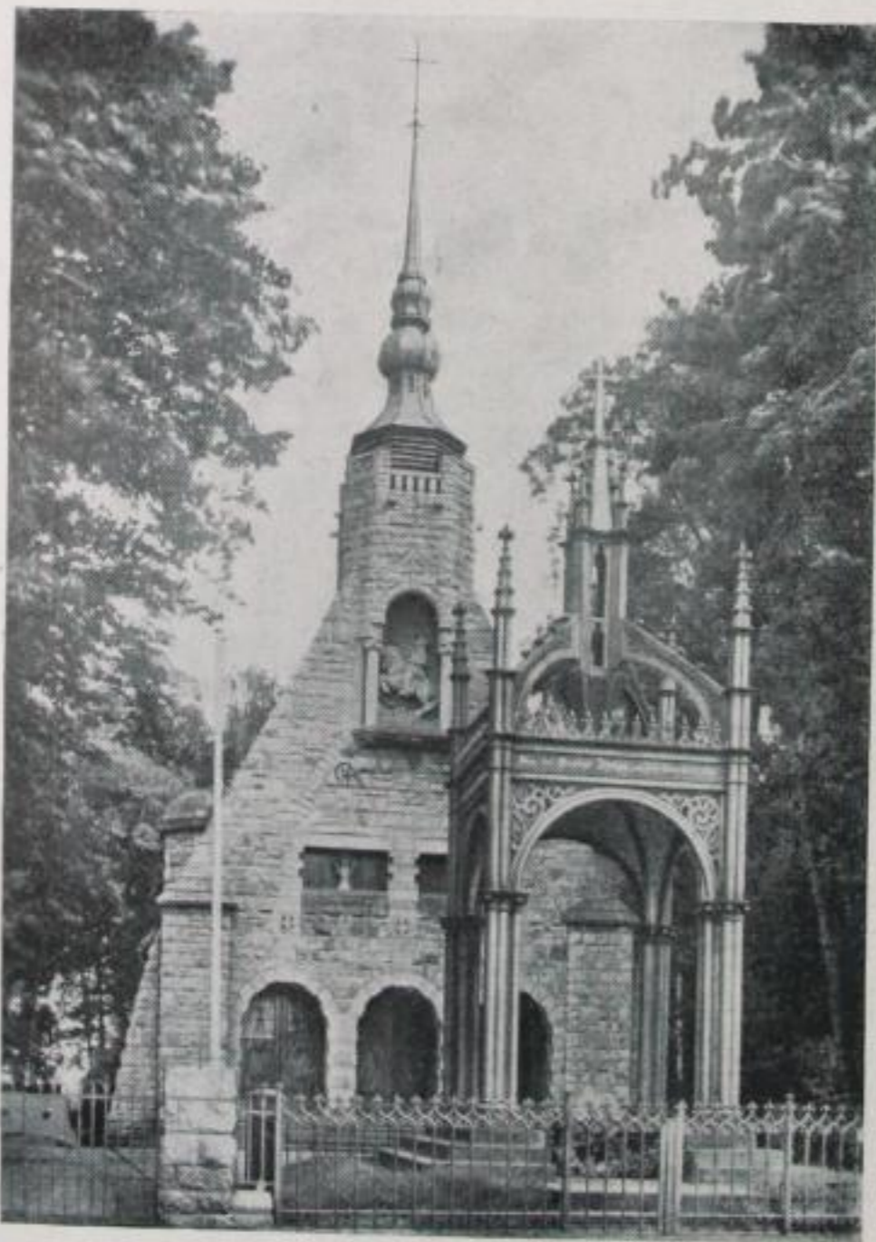
Schwedenstein mit Gustav-Adolf-Kapelle

Günstige Zugverbindung von und nach Leipzig.