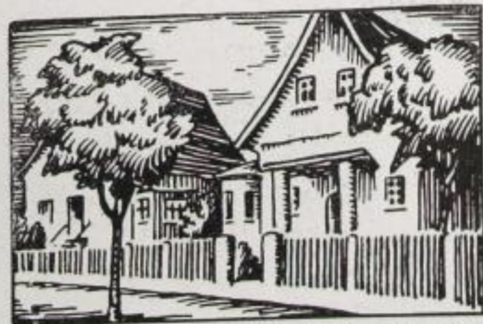
UND MODERNE SIEDLUNGEN

auf uraltem Siedlungsboden von germanischen Siedlern dem Slawentum abgerungen, ist es noch heute der Ort der Siedlungen, der Verbundenheit zwischen Mensch und Boden - und des Baumes. Es gibt in Wiederitzsch keine Straße, deren Bild nicht vom Baum beherrscht wird.