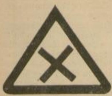
1 Achtung „Kreuzung“.