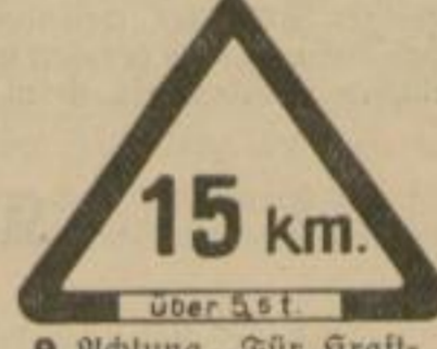
9 Achtung „Für Kraftfahrzeuge über 5,5 t Höchstgeschwindigkeit 15 km“.