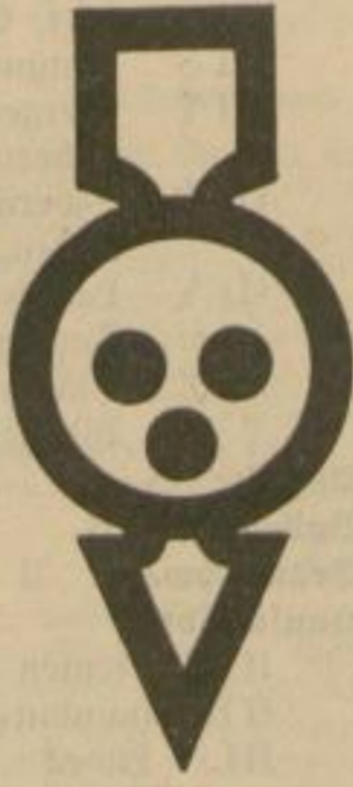
3 Gesperrt für Kraftfahrzeuge aller Art.