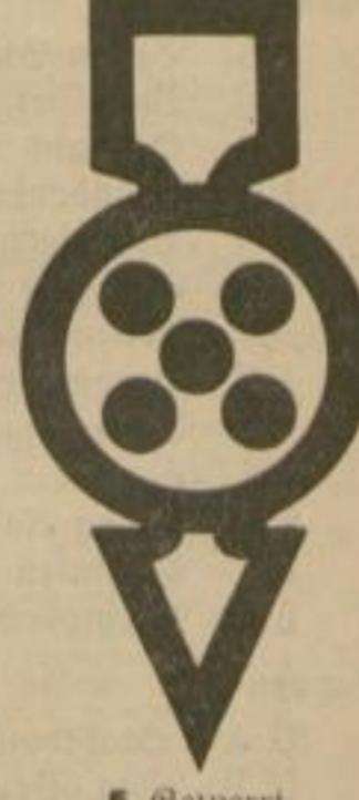
5 Gesperrt für Fahrzeuge aller Art einschl. Kleinwagen sowie für Radfahrer, Reiter und Viehtreiben.