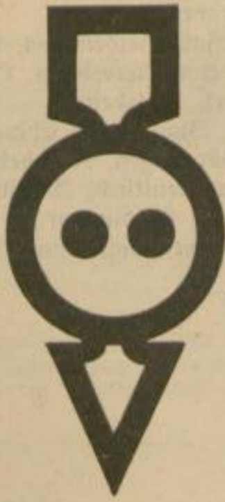
2 Gesperrt nur für Kraftwagen. Frei für Motorräder.