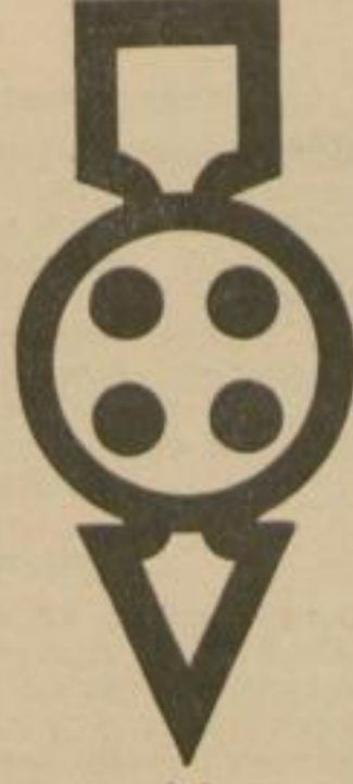
4a Gesperrt für alle Lastfahrzeuge.