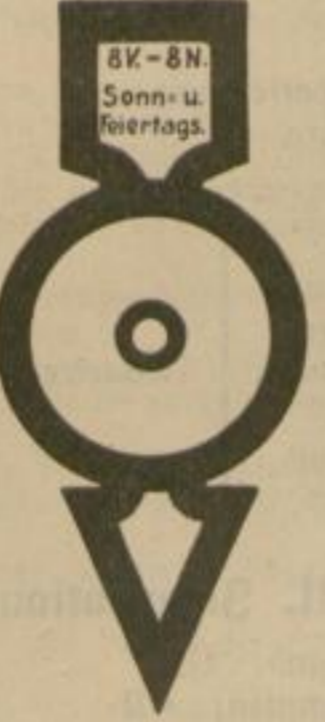
7a Gesperrt an Sonn- und Feiertagen für Fahrräder und Motorräder.