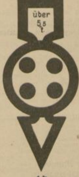
4b Gesperrt für Lastkraftfahrzeuge über 5,5 t.