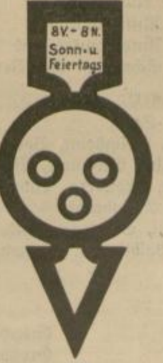
7b Gesperrt an Sonn- und Feiertagen für alle Kraftfahrzeuge.