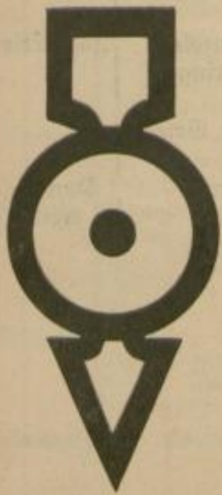
1 Gesperrt für Fahrräder und Motorräder (ohne Beiwagen).