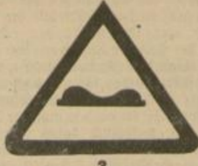
3 Achtung „Querrinne“.