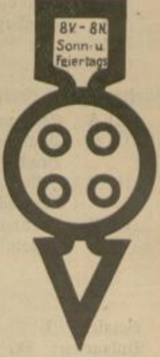
7c Gesperrt an Sonn- und Feiertagen für alle Lastwagen.