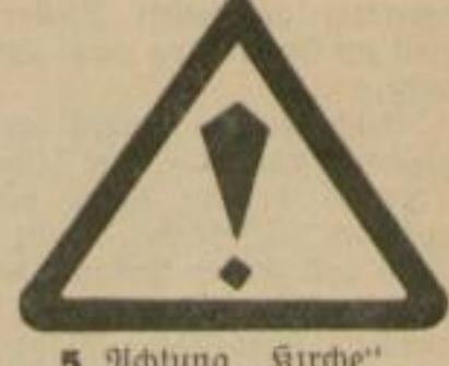
5 Achtung „Kirche“ oder „Schule“ oder „Krankenhaus“ od. dgl.