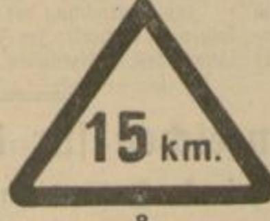
8 Für alle Fahrzeuge: „Höchstgeschwindigkeit 15 km“.