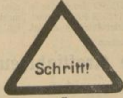
7 Achtung „Schrittgeschwindigkeit für alle Fahrzeuge“.