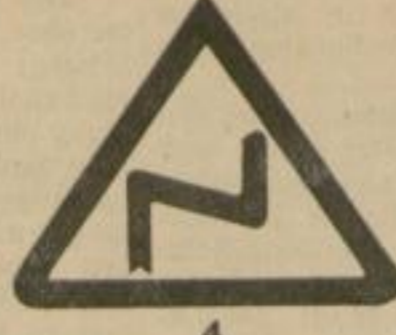
4 Achtung „Kurve“.