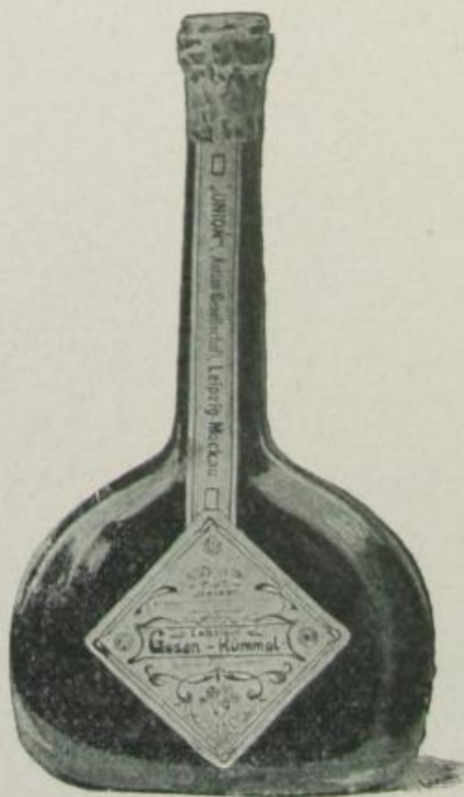
358 Leipziger Gosenkummel.