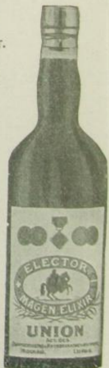
384 Elector, feiner Magenelixir.