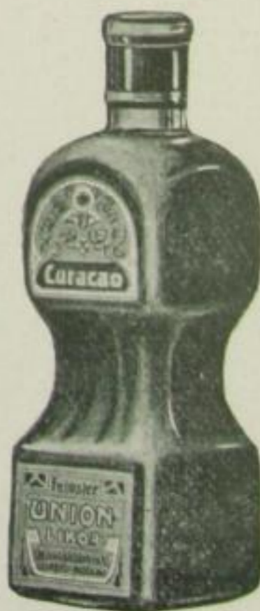
Feinste Liköre in Klucker- flaschen.