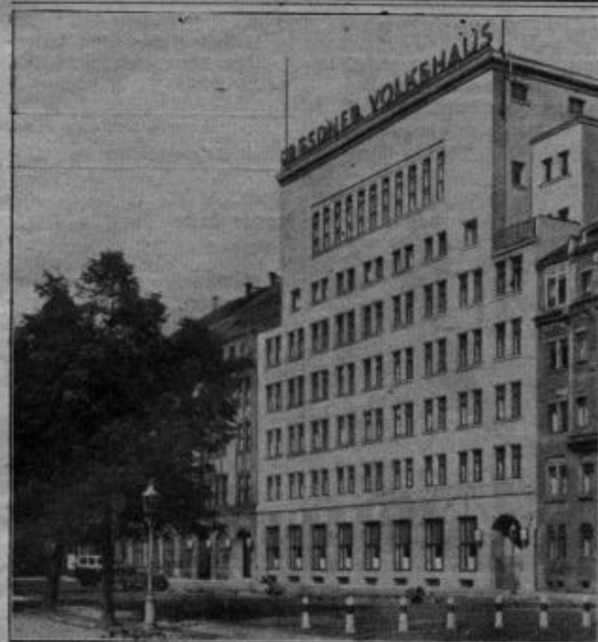
Dresdner Volkshaus Dresden-A., Schützenplatz 12-16.