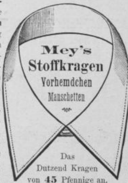
Das Dutzend Kragen von 45 Pfennige an.

sind keine Papierkragen, denn sie sind mit wirklichem Webstoff vollständig überzogen, haben also genau das Aussehen von Leinenkragen, sie erfüllen alle Anforderungen an Haltbarkeit, Billigkeit, Eleganz der Form, bequemes Sitzen u. Passen. Wenn man bedenkt, dass die leinen. Kragen beim Waschen u. Plätten oft verunstaltet, zu hart gestärkt oder schlecht gebügelt werden, oder dass sie in der Wäsche eingehen,