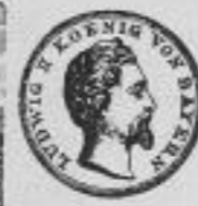
Silberne Medaille Nürnberg 1885.