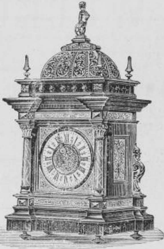
Höhe 55 cm, Breite 30 cm.