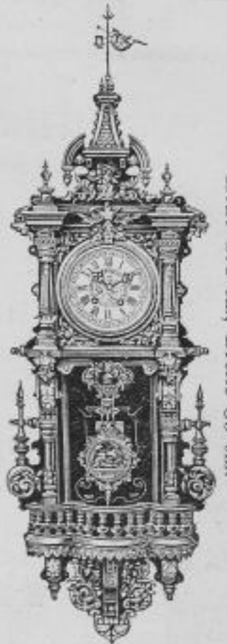
Höhe 108 cm, Breite 35 cm.