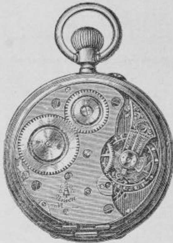
Union I offen.