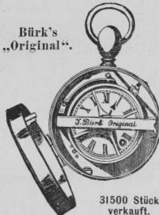
31500 Stück verkauft.