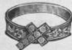
1171. Mass. silb. Damenring mit Kreuz und Türkisen Mk. —, lu.