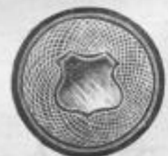
1161. Golddouble-Manchettenknopf, Paar Mk. —, lu.