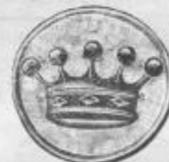
1284. Manchettenknopf mit Perlmutter-Einlage u. vergold. Krone, Paar Mk. —, ds.