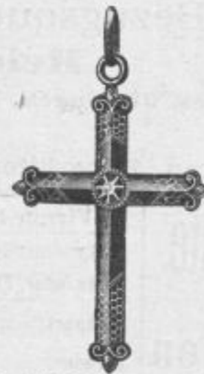
115. Golddouble-Kreuz mit Türkis Mk. —, us.