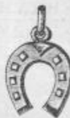
977. Massiv silb. Anhänger Mk. —, ls.