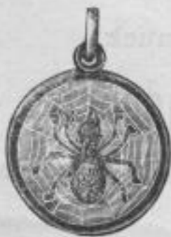
1217. Glücksanhänger, silb. verg. Spinne mit Gewebe, Mk. B, is.