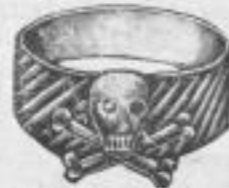
374 Totenkopfring, mass. silb., oxyd. mit goldplatt. Aufsätze Mk. —, ru.