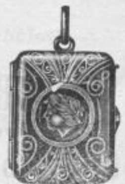
1104. Golddouble-Medallion zum Öffnen Mk. B, iu.