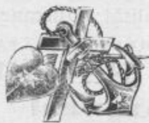
839. Golddouble-Broche mit Perle gefasst Mk. —, ds.