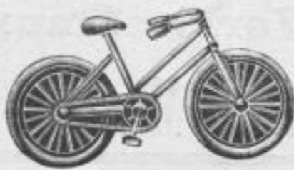
1162. Massiv silberne Broche (Damenrad) Mk. —, rs.