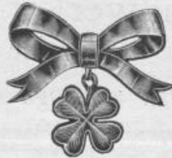
842. Golddouble-Broche mit grünemailliertem Kleeblatt Mk. B, —.