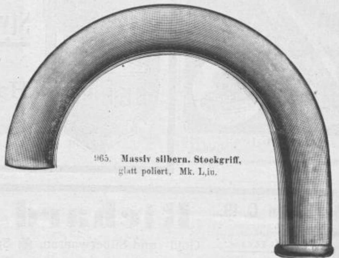
965. Massiv silbern. Stockgriff, glatt poliert, Mk. L, iu.