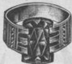
1120. Massiv Skar. gold. Herrenring Mk. D, iu.