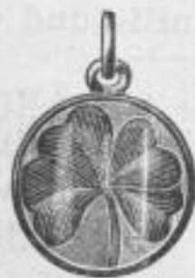
1275. Glücksanhänger mit grünemaill. Kleeblatt unter Glas Mk. —, us.