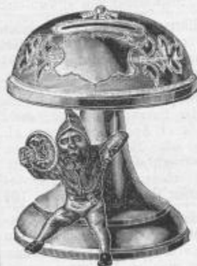
Preis 36 Mk. per Dtzd.