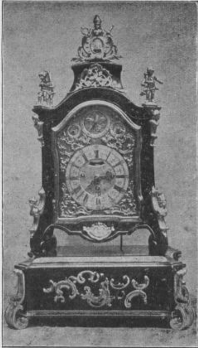
Fig. 65. Rokoko-Uhr (Louis XV.-Stil) 1740–1750.

antiken Tempeln und den Göttinnen Poussins, weg mit den frommen Märtyrern, die sich kasteien und das Fleisch töten. Der veränderte Zeitgeist modelte den Louis XIV.-Stil bis zur Unkenntlichkeit um, und was dann endlich herauskam, war das