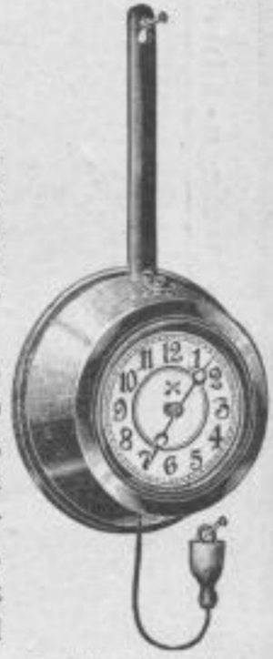
Nr. 262. Höhe 40 cm.

Nr. 262. Höchst originelle, ganz neue Küchenuhr, hat genau die Form einer kupfernen Kasserolle, Gehäuse blank verkupfert, Stiel schwarz lackiert, Zifferblatt elfen- beinfarbig, abwaschbar, 1 Tg. Gehwerk, amerik. System, mit Kordelaufzug, kein Schlüssel nötig. Mk. U,us.