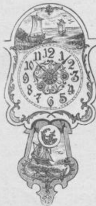
Nr. 261. Höhe 33 cm.

Uhren-Fabrikation u. Engros-Handlung. Neueste Küchenuhren.