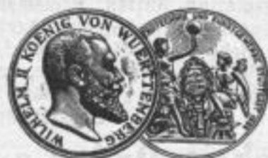
Silberne Medaille Stuttgart 1896.