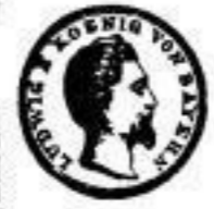
Silberne Medaille Nürnberg 1885.