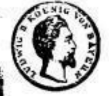
Silberne Medaille Nürnberg 1885.