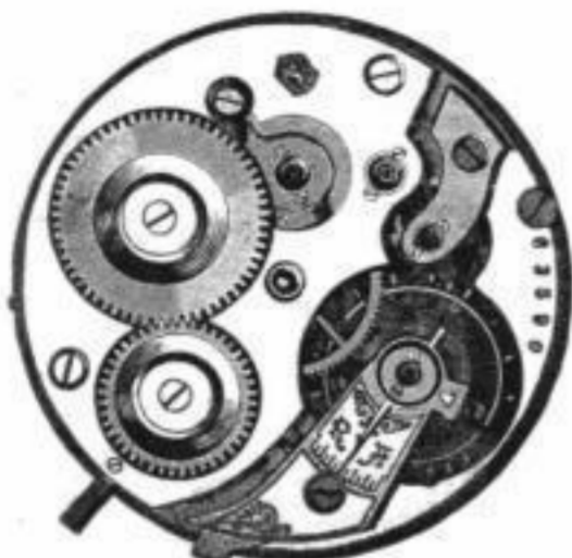
Calibre No. 52. Offen.