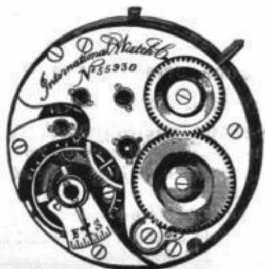
Calibre No. 59. Savonette.

Unsere Fabrikate, die sich speciell durch gute Konstruktion und sehr sorgfältige Ausführung auszeichnen, werden heute in allen besseren Uhren-Geschäften gehalten und erfreuen sich einer immer mehr zunehmenden Beliebtheit. (108)