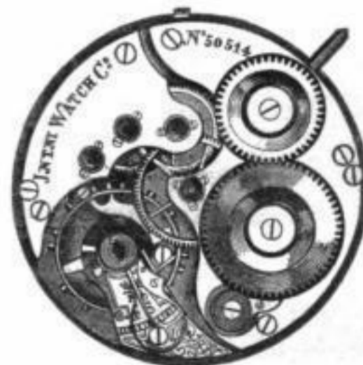
Calibre Nr. 56. Savonette.

Zur Erleichterung allfälliger Reparaturen senden wir auf Verlangen jedem Uhrmacher gratis und franco einen illustrierten Catalog, enth. sämtliche Bestandtheile unserer Fabrikation.