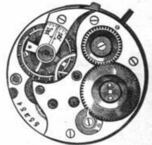
Calibre No. 55 Offen.

Unsere Fabrikate, die sich speciell durch gute Konstruktion und sehr sorgfältige Ausführung auszeichnen, werden heute in allen besseren Uhren-Geschäften gehalten und erfreuen sich einer immer mehr zunehmenden Beliebtheit. (108)