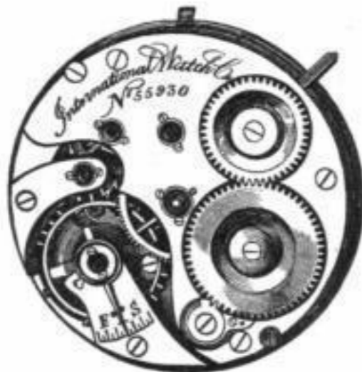
Calibre No. 59. Savonette.