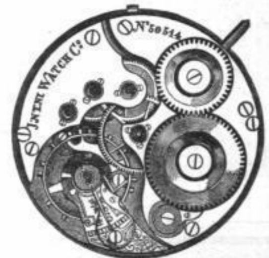
Calibre Nr. 56. Savonette.

Zur Erleichterung allfälliger Reparaturen senden wir auf Verlangen jedem Uhrmacher gratis und franco einen illustrierten Catalog, enth. sämtliche Bestandtheile unserer Fabrikation.