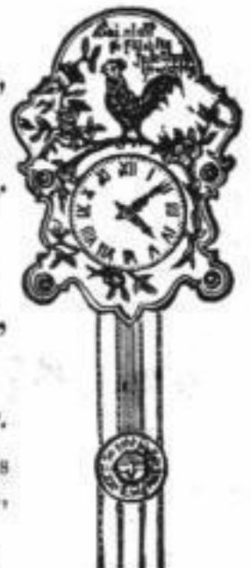
Höhe 35 cm.