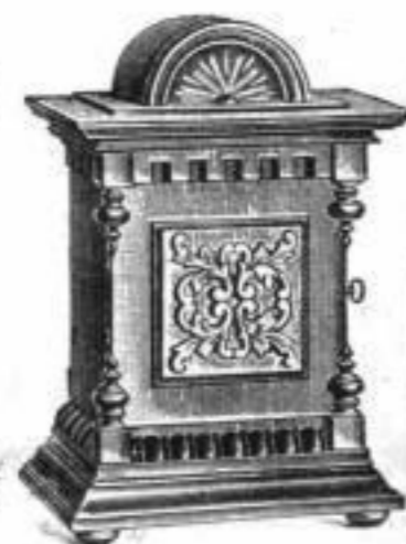
(351) 40-tönige Spieldose.

Musikwerk für Tanzlokale und grössere Restaurants. Heller angenehmer Klang.