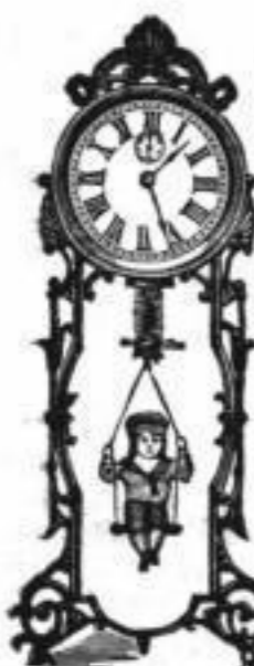
Höhe 36 cm.

Hahnenuhr. Sehr origineller alt- deutscher Holzschild (kein Lack Schild), Holzbrand mit Malerei, Schottenschlag- werk, bester Qualität, p. St. Mk. 5,—.