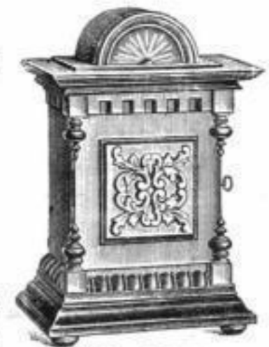
(351) 40-tönige Spieldose.

Musikwerk für Tanzlokale und grössere Restaurants. Heller angenehmer Klang.