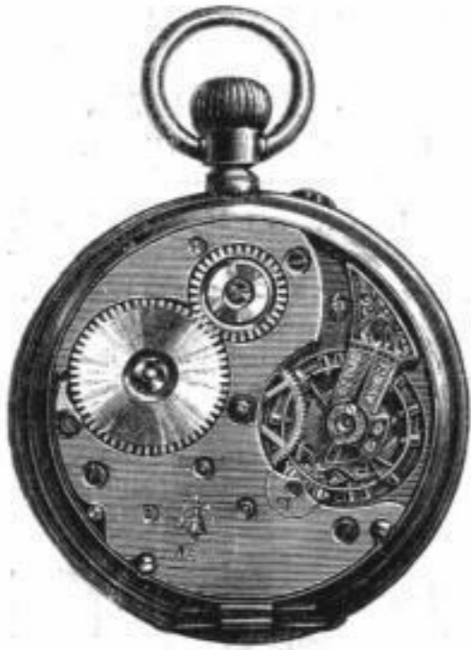
Cal. Union II offen.