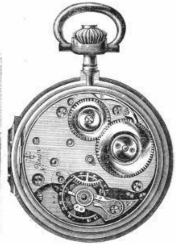
Cal. Union I sav.

Best regulirte Schweizer Uhr nach Glashütter System.