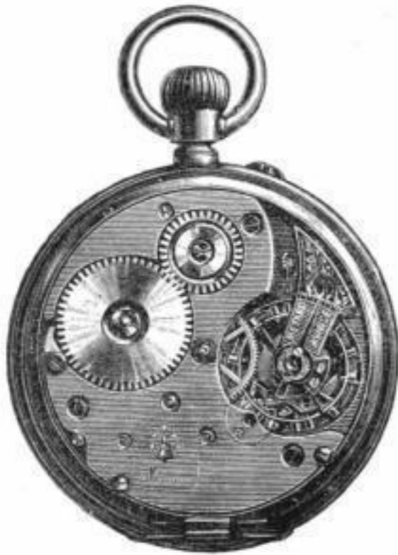
Cal. Union II offen.