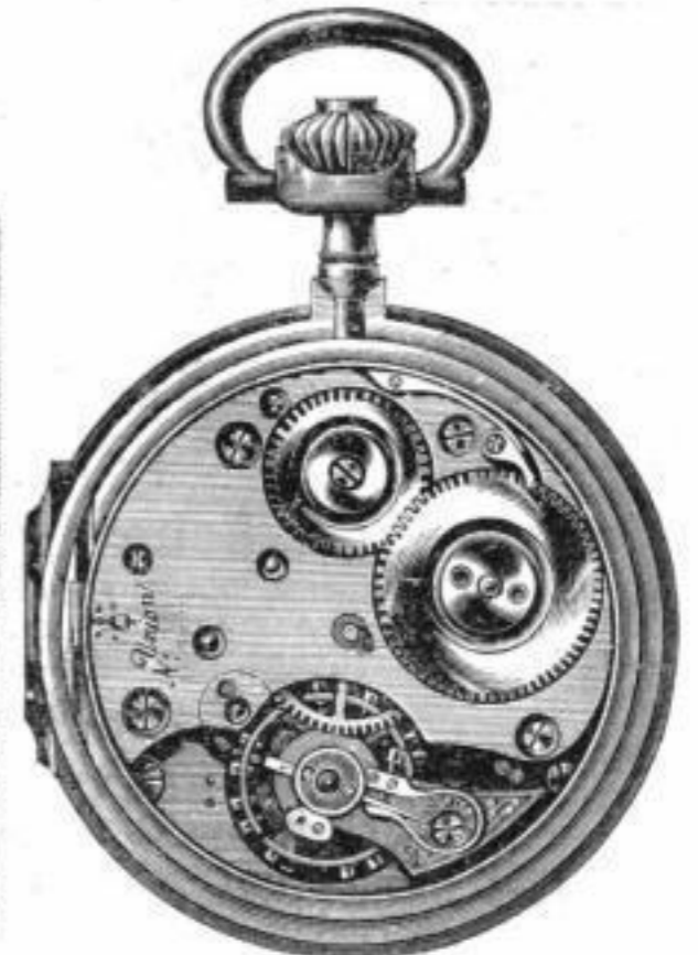
Cal. Union I sav.

Best regulirte Schweizer Uhr nach Glashütter System.