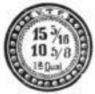
Fabrik - Marke.