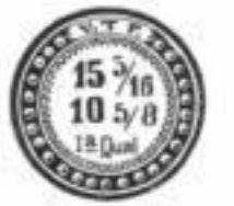
Fabrik - Marke.