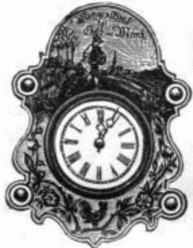
Nr. 727. Höhe 30 cm.

Hahnenuhr. Sehr origineller altdeutscher Holzschilde (kein Lackschild), Holzbrand mit Malerei, Schottenschlagwerk, bester Qualität, p. St. Mk. 5,—.