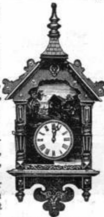
Nr. 728. Höhe 56 cm.