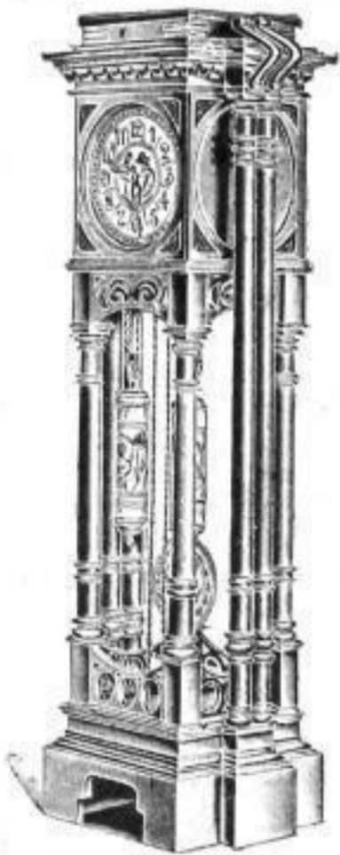
Postamentuhr 1: Mahagoni od. Eichen.

Wer noch nicht im Besitze unserer neuesten, 176 Seiten starken, reich illustrierten Haupt-Preisliste ist, erhält dieselbe auf Wunsch gratis und franko.