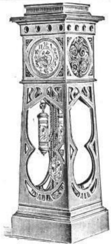
Postamentuhr 2: Nussbaum.

Glockengong in Regulateure und Hängeuhren unübertroffen.