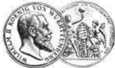
Silberne Medaille Stuttgart 1896.