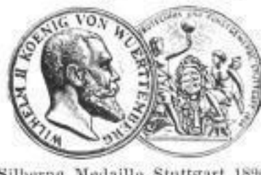
Silberne Medaille Stuttgart 1896.

Fabrikation feiner Uhrmacherwerkzeuge. Bezug durch alle Werkzeughandlungen.