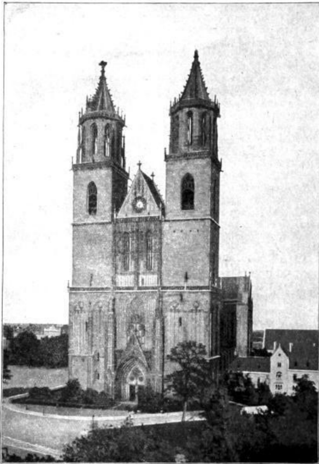
Der Dom, Westseite mit Hauptportal.