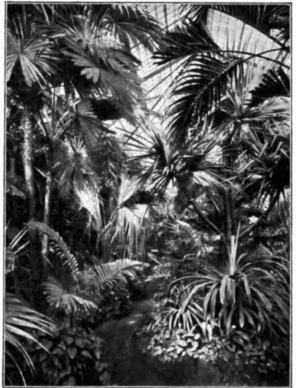
Aus dem Palmenhause in den städtischen Gruson-Gewächshäusern.