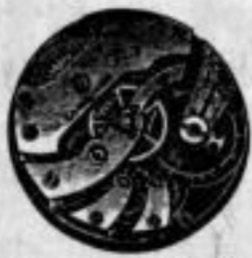
Von 8" bis 13"