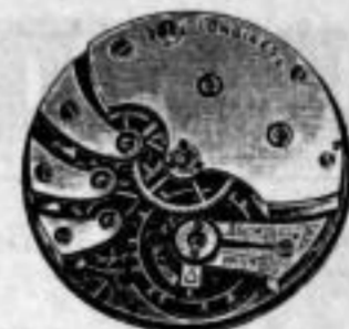
11" u. 13"