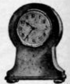
Höhe 9 cm