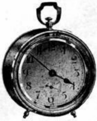
Höhe 15 cm