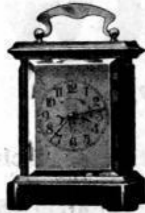
Höhe 14 1/2 cm