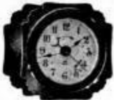
Höhe 6 1/2 cm

Unerreicht in Stärke, Schönheit, Haltbarkeit