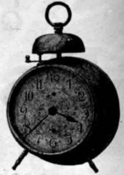
Höhe 18 1/2 cm