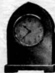
Höhe 9 1/2 cm