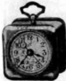
Höhe 8 cm