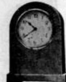
Höhe 9 cm