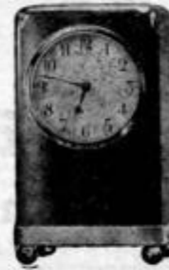
Höhe 12 cm