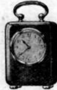
Höhe 10 cm