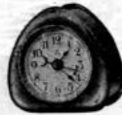
Höhe 7 cm