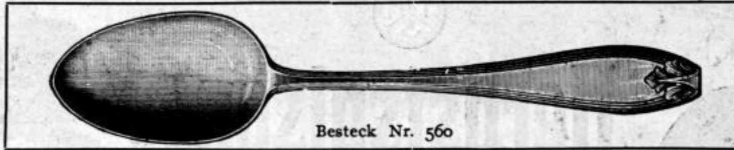
Besteck Nr. 560

Abteilung III Aifenide- und Neusilberwaren (Patengeschenke), Tassen, Becher, Spardosen usw.