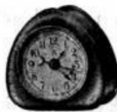
Höhe 7 cm