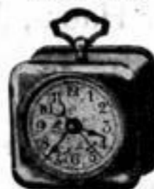
Höhe 8 cm