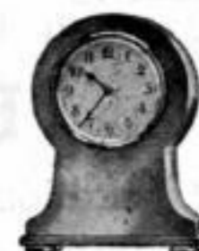
Höhe 9 cm