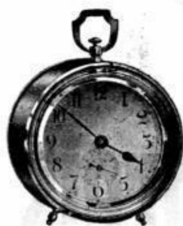
Höhe 15 cm