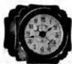
Höhe 6 1 / 2 cm

Unerreicht in Stärke, Schönheit, Haltbarkeit