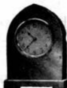
Höhe 9 1 / 2 cm