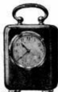
Höhe 10 cm