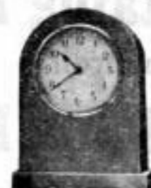
Höhe 9 cm