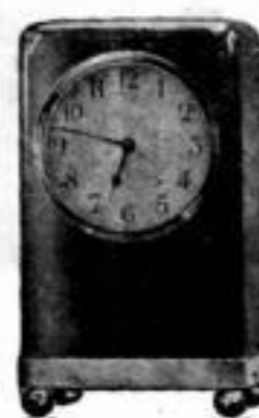
Höhe 12 cm