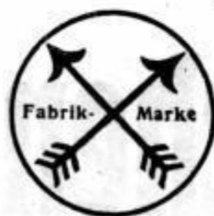
Kiri Nr. 166 1 / 2