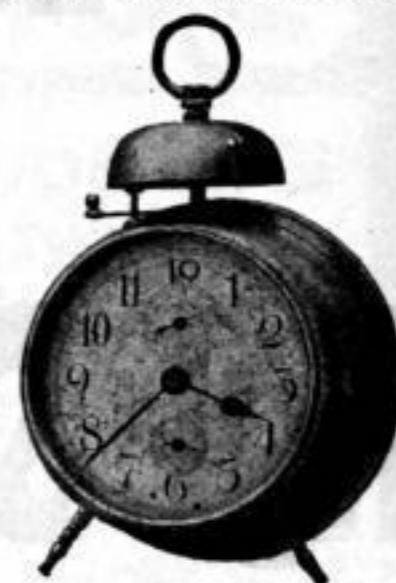
Höhe 18 1 / 2 cm