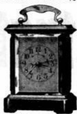
Höhe 14 1 / 2 cm