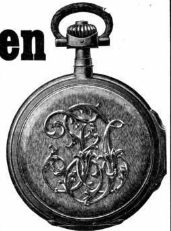
Gehäuseform Louis XV. Monogramm in Froissé-Grund.