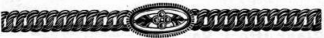
Nr. 13854, Union, \frac{50}{1000} , matt, 4 rote Steine.