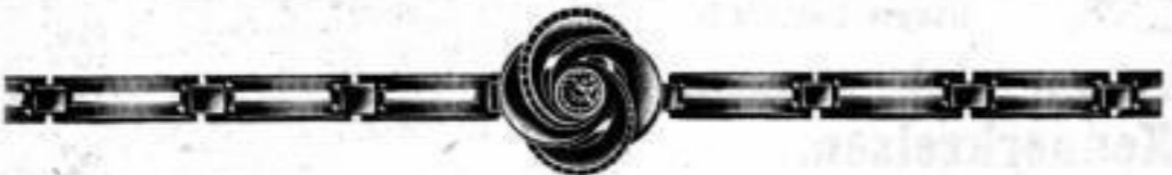
Nr. 13853, Union, \frac{50}{1000} , glanz, 1 roter Stein.