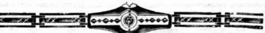
Nr. 13855, Union \frac{50}{1000} , glanz, 1 roter Stein.