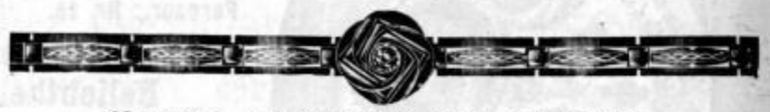
Nr. 13860, Amerik. Doublé, glanz, 1 roter Stein.