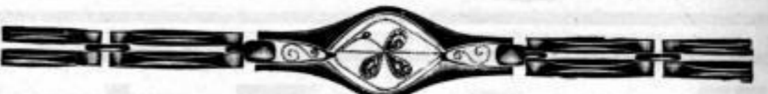
Nr. 13862, Amerik. Doublé, glanz, 3 rote Steine.