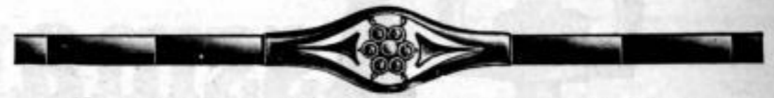
Nr. 13858, Union, \frac{50}{1000} , glanz, 4 blaue Steine, 1 Perle.