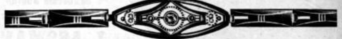
Nr. 13861, Amerik. Doublé, glanz, 3 rote Steine.