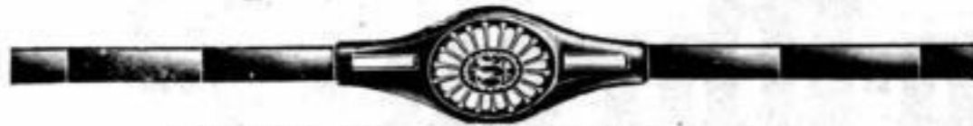
Nr. 13851, Union, \frac{50}{1000} , matt, 1 Amethyst.