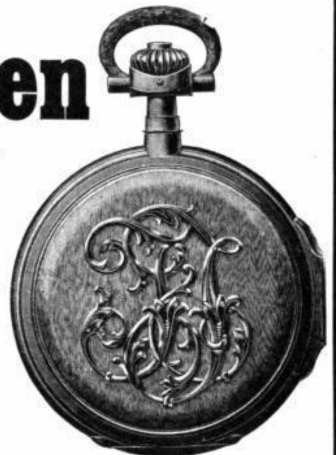
Gehäuseform Louis XV. Monogramm in Froissé-Grund.