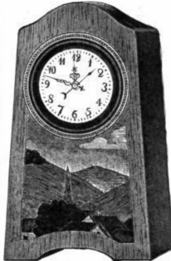
Höhe etwa 12 cm

Uhrenfabrikation u. Engroshandlung. Alle Artikel der Grossuhrenbranche, Junghans-Taschenuhren.