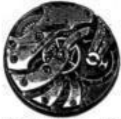
Von 8''' bis 13'''

Auswahlsendungen bereitwilligst und franko.