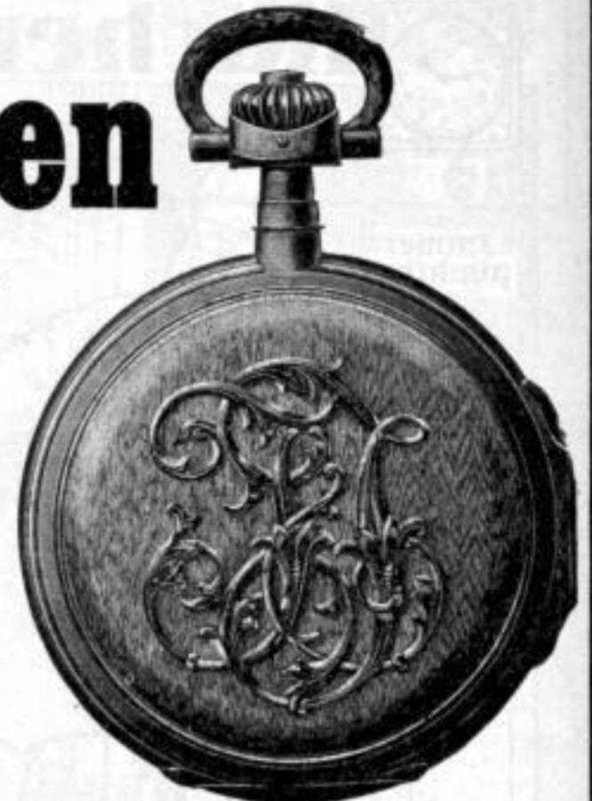
Gehäuseform Louis XV. Monogramm in Froissé-Grund.

J. ASSMANN, Glashütte i. Sa. Deutsche Präzisions-Taschenuhrenfabrik.