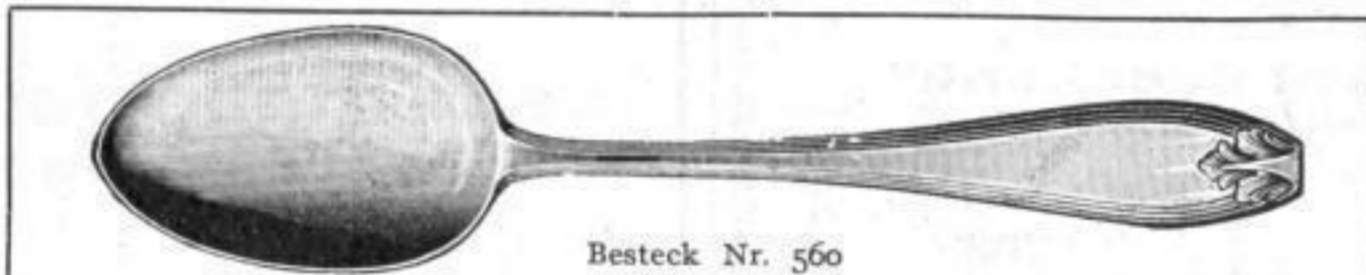
Besteck Nr. 560

Zu den Sockeln gratis ein versilbertes Schild mit Sinnspruch