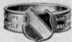
Nr. 1001. Dutzend: Mk. BU,iu.