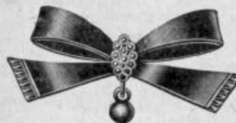
Nr. 427. Mk. U,au.