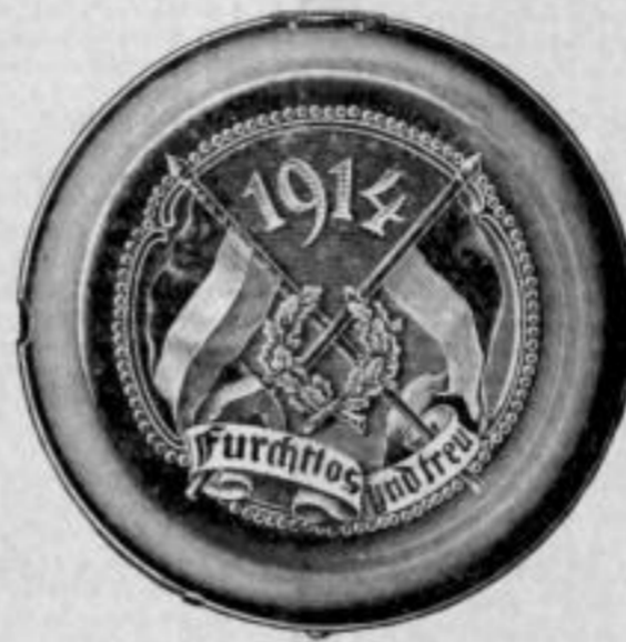
Prägung auf der Rückseite.