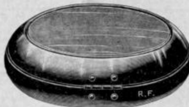
Ansicht von Nr. 6074.