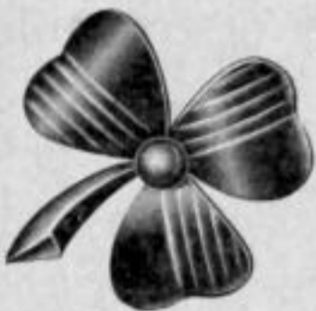
Nr. 426. Dutzend: Mk. U,au.