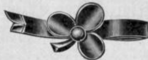
Nr. 428. Mk. U,au.