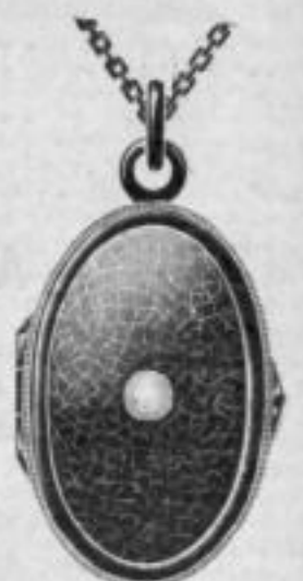
Nr. 2051. Mk. A,rs. Stahl oxydiert mit Perle.

Reklameschilder für Nationalschmuck und Trauerschmuck gratis.