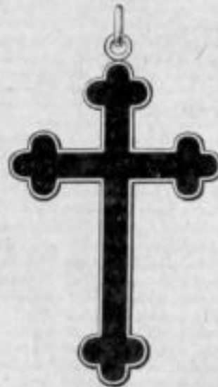
Nr. 1914 1/2 . Mk. A,as.