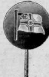
Nr. 203. Matt.