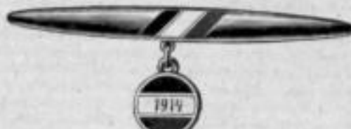
Nr. 1052. Mk. B,us.