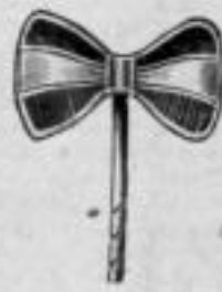
Nr. 202. Poliert.