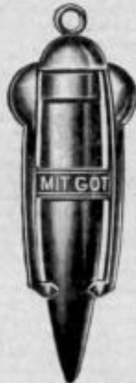
Nr. 1032 ohne Geschoss. Dtzd. Mk. BL,ds.