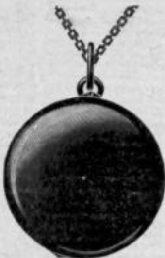
Nr. 2054. Mk. A,du. Stahl oxydiert.