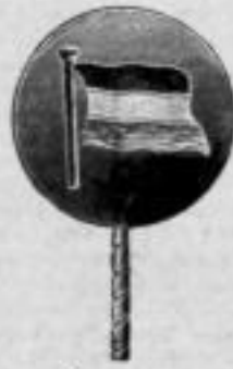
Nr. 101. Matt.