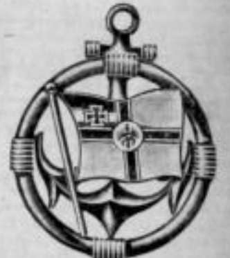
Nr. 1034. Dtzd. Mk. BN,—.

Nadeln mit deutscher oder Marineflagge, prima Emaille.