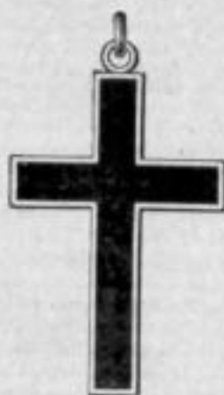
Nr. 1913 1/2 . Mk. B,uu. 800/000.