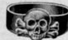
Nr. 1011. Dtzd. Mk. U,ls.