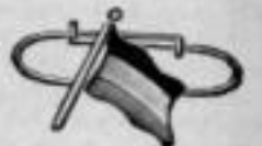
Nr. 1012. Am. Doublé. Dtzd. Mk. U,bs.

Armreifen in Prima Alpaka mit emaillierter Flagge.