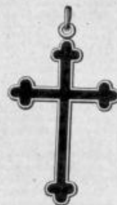
Nr. 1912 1/2 . Mk. B,du. 800/000.