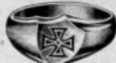
Nr. 1008. Dtzd. Mk. BA,ju.