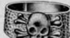
Nr. 1010. Dtzd. Mk. R,ju.