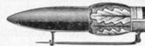
Nr. 137. Mk. B, us.