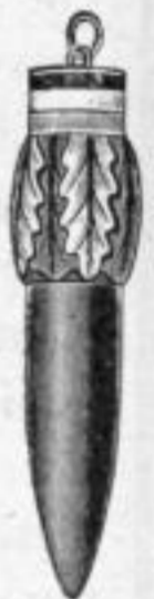
Nr. 138. Mk. B, ds.