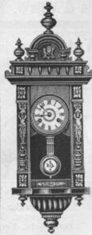
Höhe 68 cm.