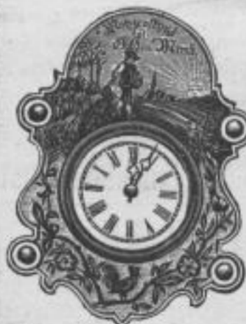
No. 772. H. 30 cm.

mit reich bemaltem Schild (kein Lackschild) Schlagwerk. M. 4,50.