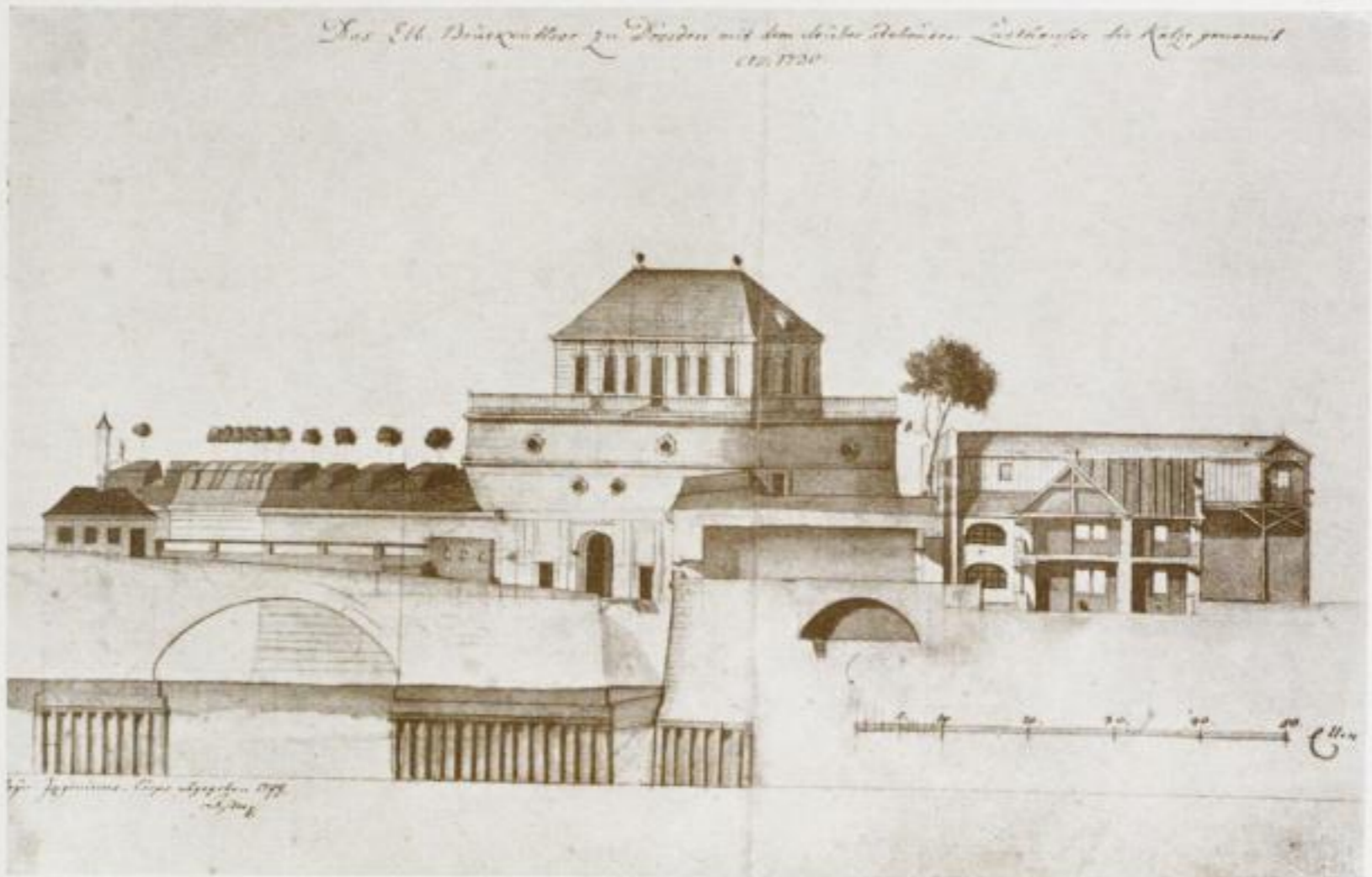
30. Das Elbtor 1730. (Plan des Hauptstaatsarchivs.)