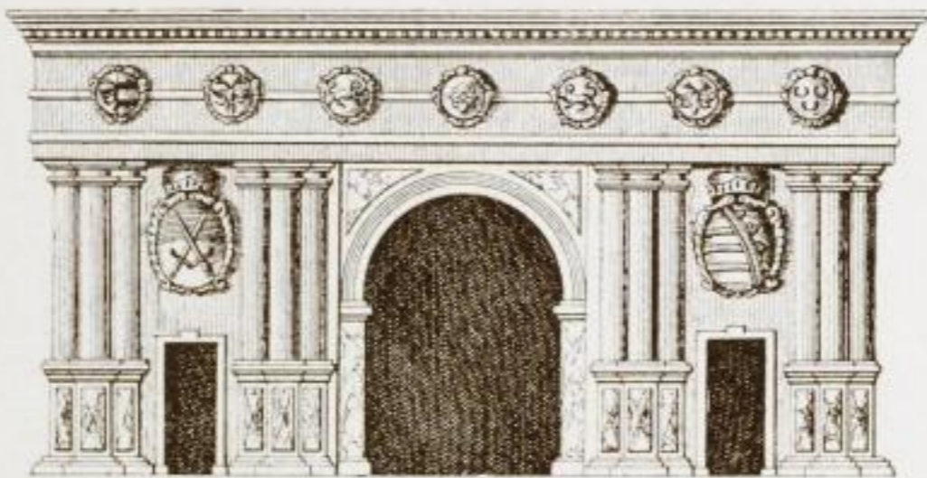
53. Das Schöne Tor. Nach Hilscher. (Aus Förster, Augustusbrücke.)